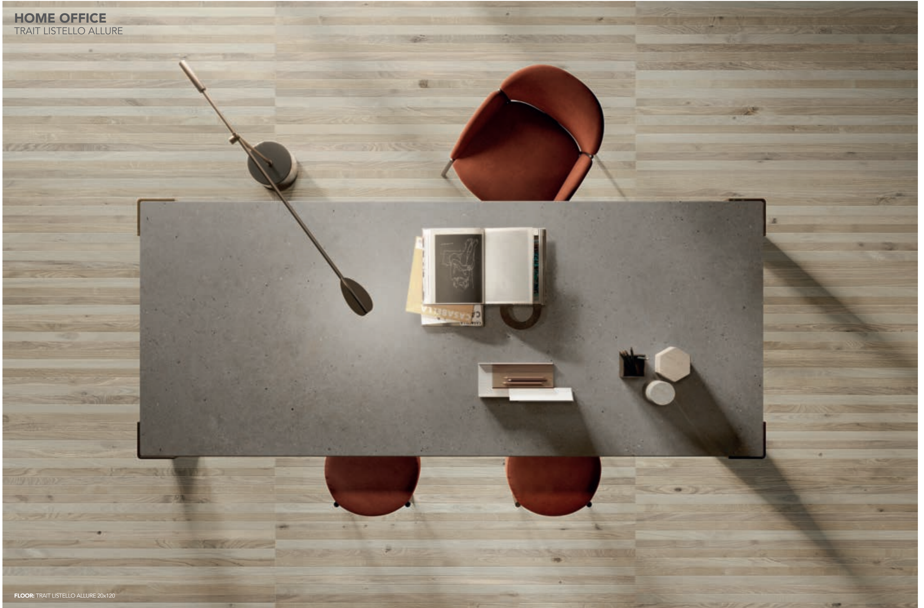
FLOOR: TRAIT LISTELLO ALLURE 20x120